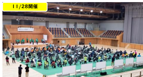
介護予防住民指導者フォーラム