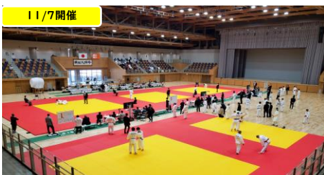
長野県高校新人体育大会柔道競技